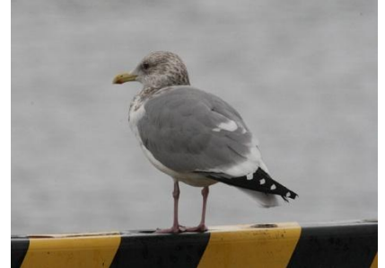
「セグロカモメ カモメ科」

冬鳥。全長 55cm。トビより一回り小さいタカで、脇から腹回りにある茶色の横線が特徴。