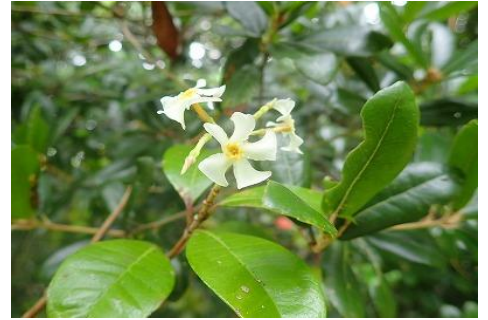
「テイカカズラ キョウチクトウ科」

海岸沿いの林下に生える常緑つる性の多年草。花は6cmほどと大きく良い香りがする。