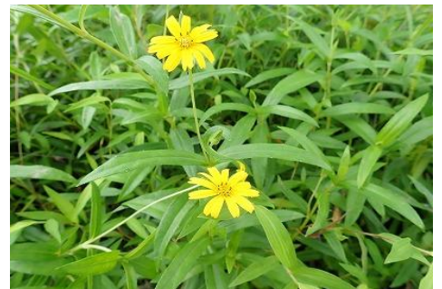
☆「クマノギク キク科」☆

北アメリカ原産の帰化植物。驚異的な繁殖能力を持っており要注意外来植物に指定されている。