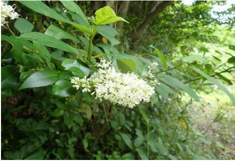
「ネズミモチ モクセイ科」

暖地の山地に生える常緑小高木。新しい枝先に真っ白い花の塊をつけるので遠めにもよく目立つ。