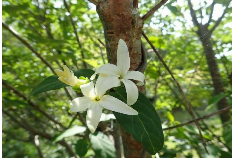
☆「シタキソウ キョウチクトウ科」☆

暖地の山地に生える常緑小高木。新しい枝先に真っ白い花の塊をつけるので遠めにもよく目立つ。