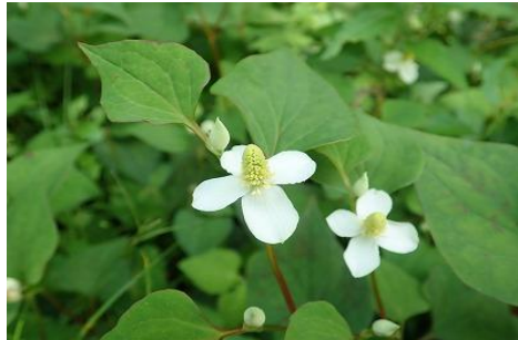
☆「ドクダミ ドクダミ科」☆

道端や芝生に生える多年草。北アメリカ原産の帰化植物。花には紅紫色と白色のタイプがある。