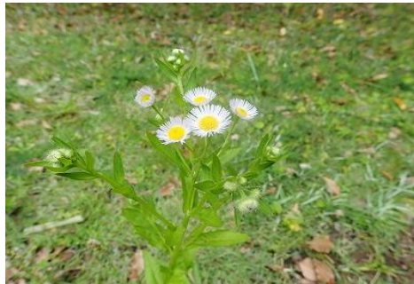
☆「ヒメジョオン キク科」☆

暖地の海岸に近い林でよく目に付く雌雄異株の落葉高木。ビワではなくイチジクの仲間。