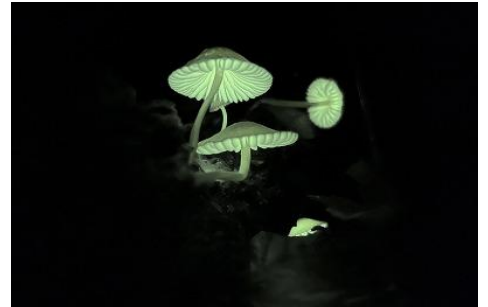
「シイノトモシビタケ キシメジ科」

湿り気のある所を好む多年草。生薬として10種類の薬効を有していることから十薬(じゅうやく)とも。