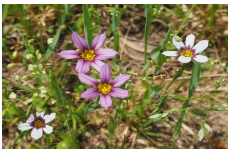
☆「ニワゼキショウ アヤメ科」☆

海岸近くのやや湿った所に生える多年草。熊野地方で発見された。ここでは玄関前に植栽されている。