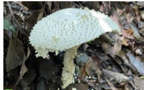
シロオニタケ 様々なキノコが生える季節になりました。毒キノコもありますので触らないようにしてください。