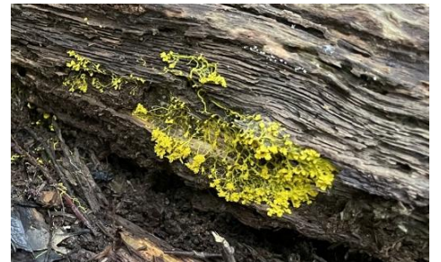
変形菌(粘菌) キフシスホコリ 移動しつつ摂食する動物的性質と胞子により繁殖する植物的性質を併せ持つ生物です。