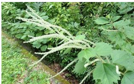
☆「ヤブマオ イラクサ科」☆ 山野でよく見られる多年草。円形の葉が特徴的。かつては茎の植物繊維から糸を紡いで布を織っていたという。