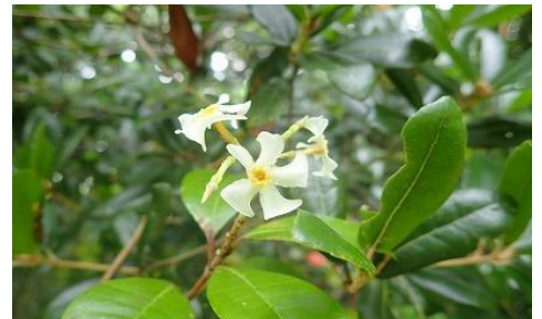
「テイカカズラ キョウチクトウ科」 暖地の林に生えるつる性の常緑低木。花は白色から黄色に変わる。花弁の先は、ねじれプロペラ状。