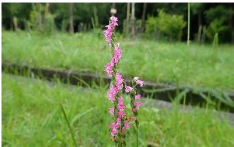
☆「ネジバナ ラン科」☆ 日当たりの良い芝生などに生育する多年草。花は茎の周りに螺旋状に咲く。右巻き左巻き、直線のもの様々あり。