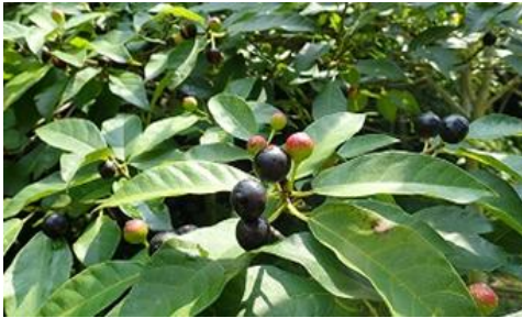
☆「イヌビワ クワ科」☆ 雌雄異株の小高木。ビワではなくイチジクの仲間。黒紫色に熟した雌株の実甘い。