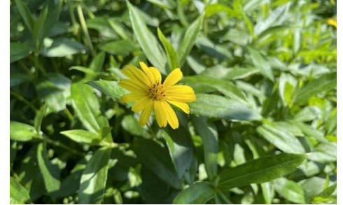
☆「クマノギク キク科」☆ 海岸近くのをやや湿った所に生える多年草。熊野地方で発見された。センターでは玄関前に植栽している。