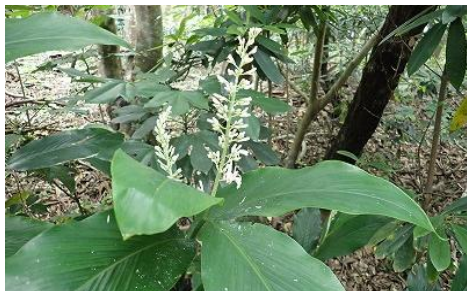
☆「アオノクマタケラン ショウガ科」☆ 湿った林下に生える常緑多年草。果実は赤い球形。和歌山県の絶滅危惧Ⅱ類に指定されている。