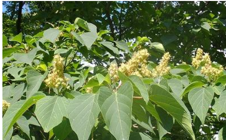
☆「アカメガシワ トウダイグサ科」☆ 落葉高木。柔らかいトゲのある幼果実が突っている。秋に熟し、黒紫色の種子を出す。